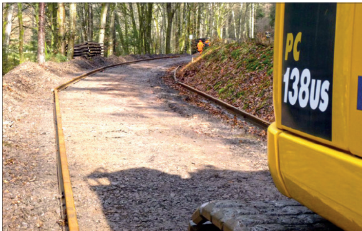
Bereitstellung der neuen Gleise.