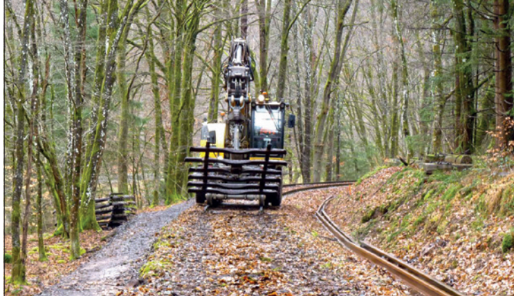
Abbau des alten Gleises.