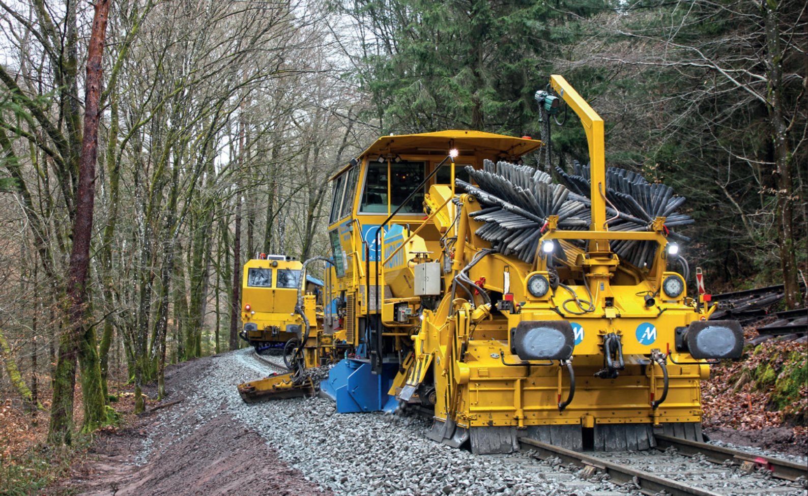
Nach der Stopfmaschine (im Hintergrund) vollendet die Schotterverteiler- und Planiermaschine SSP 110 SW die Verlegearbeiten.