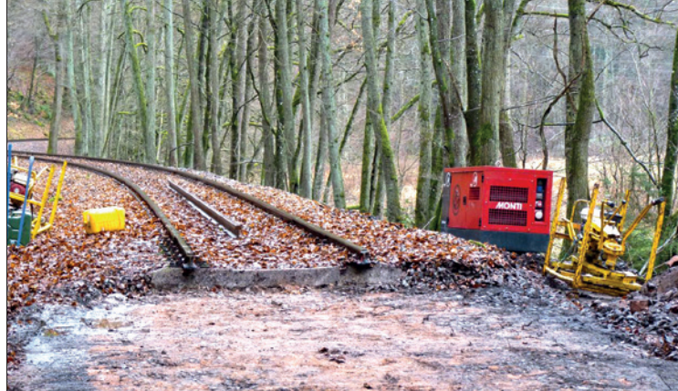
Neu eingebaute und verdichtete Schottertrasse.