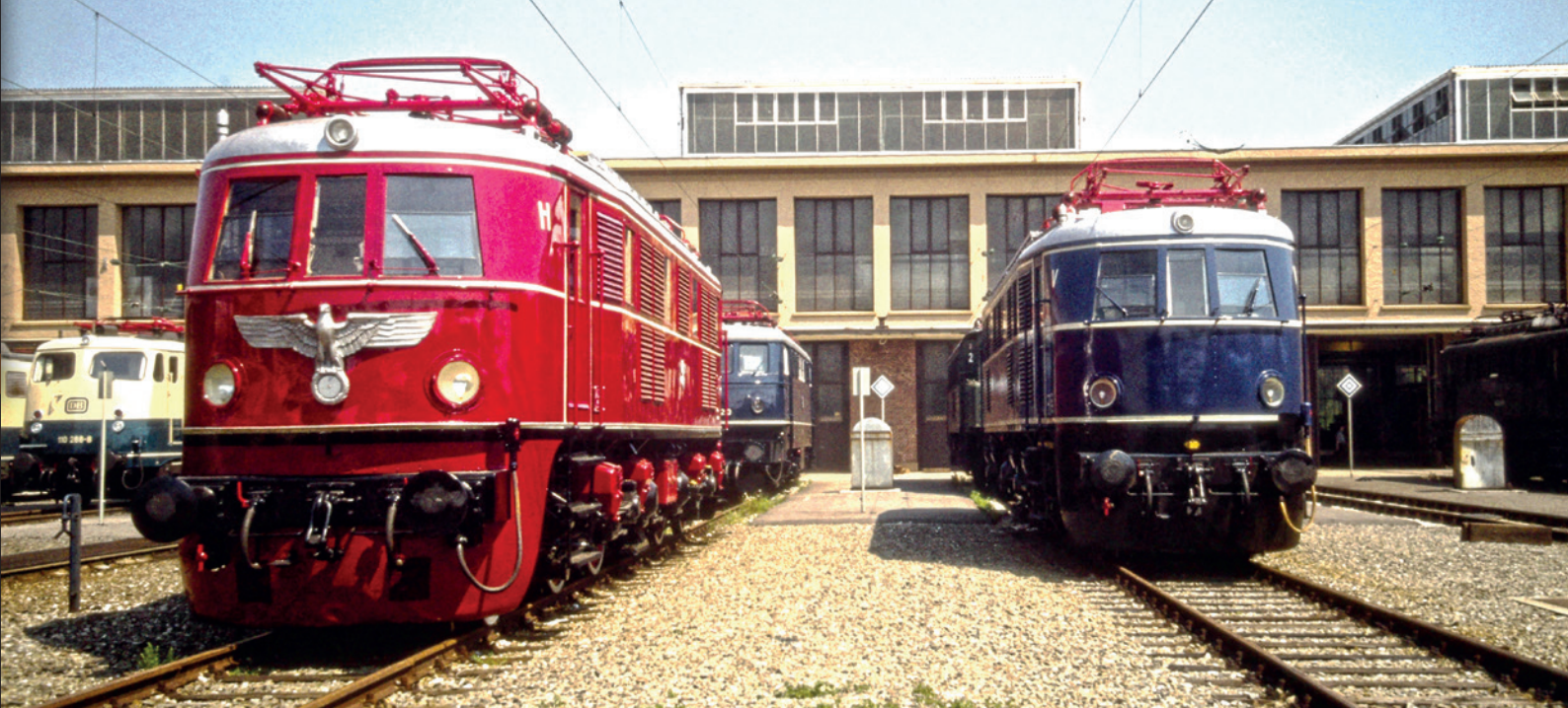
Ausstellung „100 Jahre elektrische Traktion“ Ende Mai 1979 in München-Freimann.