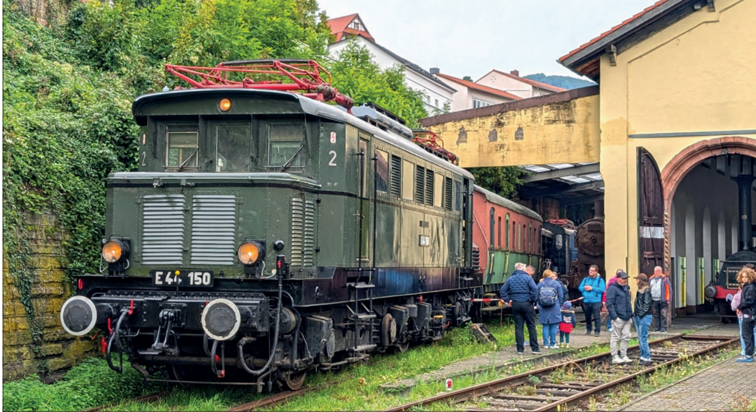
Fachkundige Führerstandsführungen – einer der Anziehungspunkte des Kinderfests.