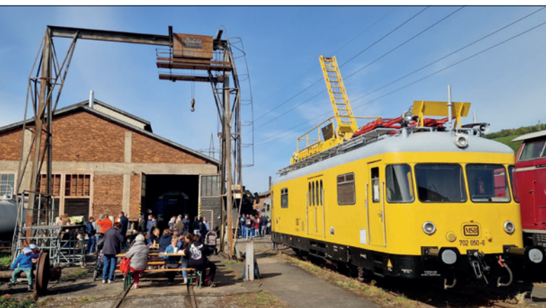
Der frisch sanierten Turmtriebwagen 702 050 der Mainschleifenbahn.