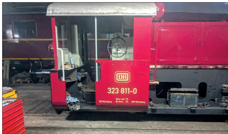
Köf im frischen Lack und neuer Beschriftung.