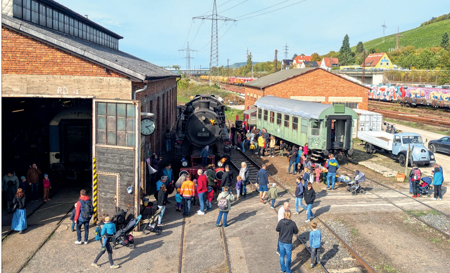
Maus-Tag – auch in diesem Jahr wieder ein gut besuchtes Fest.