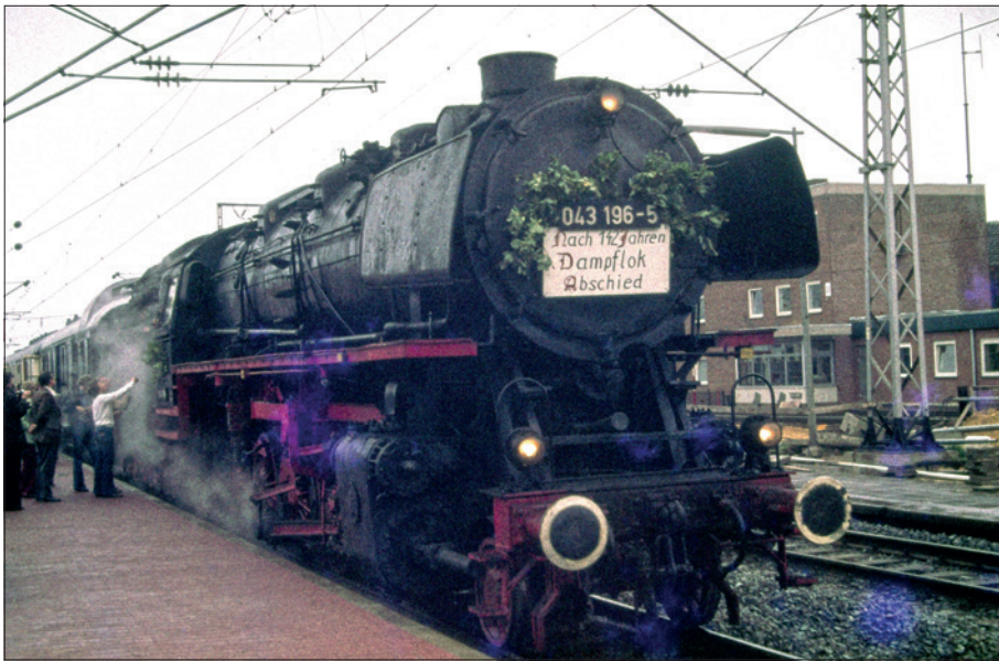
Abschied vom Dampf: 043 196 am 23. Oktober 1977 in Papenburg