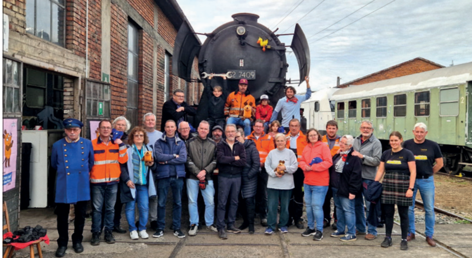
Die Aktiven am Ende des Tages, aber nicht am Ende, sondern sehr zufrieden.