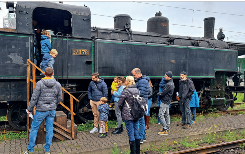
Reges Interesse bei Groß und Klein fanden die Führerstandsführungen der unter Dampf stehenden 378.78 Hark-Oluf Asbahr

historischen Verein der Pfalz und der Industriekultur RLP e. V. statt.